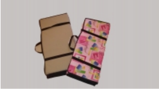
ĐšĐ¾Đ²Ñ€Đ, Đ° Đ´Đ»Ñ• Ñ,,Đ,Ñ,Đ½ĐμÑ•Đ° Ñ•Đ°Đ»Đ°Đ´Đ½Đ¾Đ¹ Đ´Đ,Đ´ 2

ĐšĐ¾Đ²Ñ€Đ, Đ° Đ´Đ»Ñ• Ñ,,Đ,Ñ,Đ½ĐμÑ•Đ° Ñ•Đ°Đ»Đ°Đ´Đ½Đ¾Đ¹ Đ´Đ,Đ´ 2 [Product Details...]