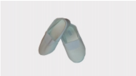
Đ§ĐμÑ´Đ°Đ, Đ±ĐμĐ»Ñ«Đμ Đ,Ñ•Đ°ÑfÑ•Ñ•Ñ,Đ²ĐμĐ½Đ½Đ°Ñ• Đ°Đ¾Đ¶Đ°

Đ´Đ°Đ»ĐμÑ,Đ°Đ, Ñ‡ĐμÑ€Đ½Ñ«Đμ [Product Details...]